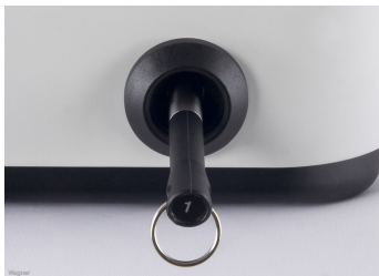
Optional ist die ECR-1810 mit einem elektronischen Bediener- / Kellenschloss für maximale Sicherheit nachrüstbar