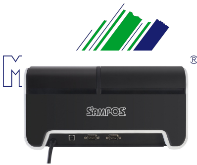
Auf der Rückseite der ECR-1810 finden Sie eine USB und eine serielle Schnittstelle.